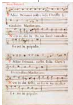
Seite aus einer Passion Pujols

weitgehend erhalten ist, dessen Bedeutung für die katalanische Musik gar nicht hoch genug eingeschätzt werden kann und der dennoch nur wenigen Spezialisten bekannt ist.